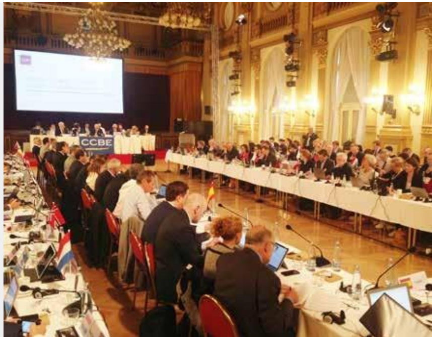
Празька Пленарна сесія